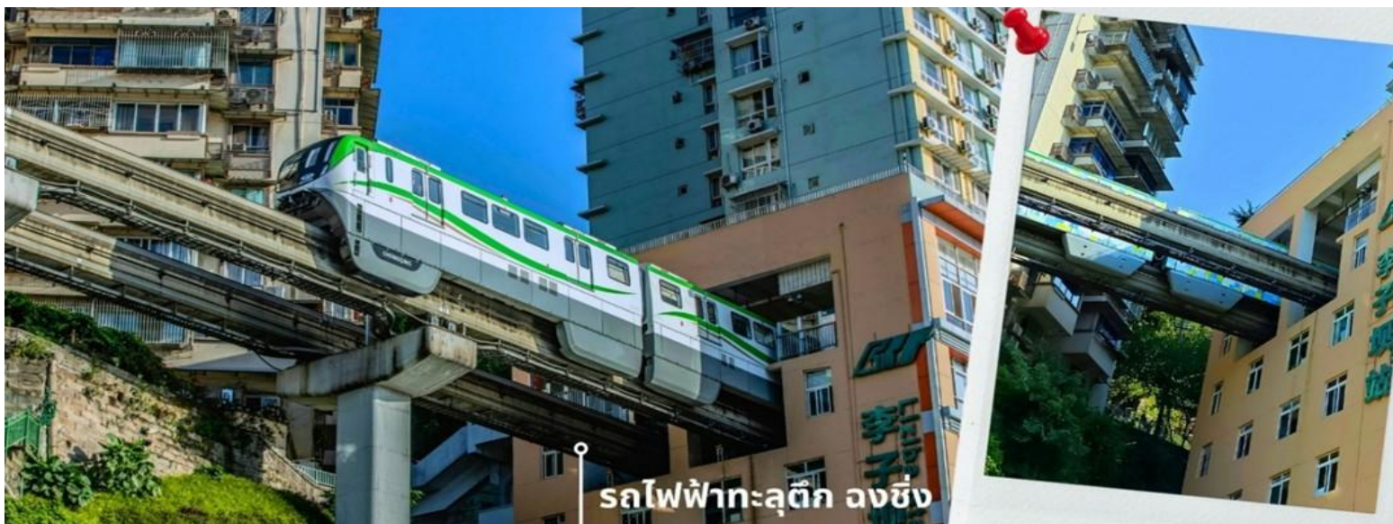
รถไฟฟ้าทะเลตึก ลงชิง

จากนั้นนำท่านนั่งรถไฟฟ้าทะเลตึก หรือ สถานี Liziba เป็นสถานีรถไฟฟ้าแบบชานชาลา สิ่งที่ทำให้สถานี Liziba มีชื่อเสียงไปทั่วโลกคือ “เส้นทางรถไฟที่วิ่งทะลุผ่านอาคารสูง 19 ชั้น” โดยมีระบบลดเสียงและแรงสั่นสะเทือน ทำให้ผู้ที่อาศัยอยู่ในตึกไม่ได้รับผลกระทบจากเสียงดังมาก กลายเป็นภาพอันน่าตื่นตาตื่นใจของผู้ที่มาเยือนทั้งนักท่องเที่ยวที่เดินทางมาเป็นครั้งแรก ผู้โดยสารบนขบวนรถไฟและผู้เข้าชมจากจุดชมวิวที่ต่างตื่นเต้นไปตามๆกันกับการที่ได้เห็นรถไฟวิ่งทะลุตึกนี้ สถานี Liziba ได้รับการยกย่องให้เป็น 1 ในสถานที่สำคัญที่สะท้อนความเติบโตของจีนตลอด 70 ปี ซึ่งไม่ได้เกิดขึ้นโดยบังเอิญ รถไฟฟ้าทะเลตึกนี้คือตัวอย่างของความอัจฉริยะในการออกแบบการคมนาคมในเมืองภูเขาแห่งนี้ให้ท่านได้สัมผัสประสบการณ์กับการขึ้นนั่งบนรถไฟเพื่อผ่านทะเลตึกและเก็บภาพบรรยากาศ