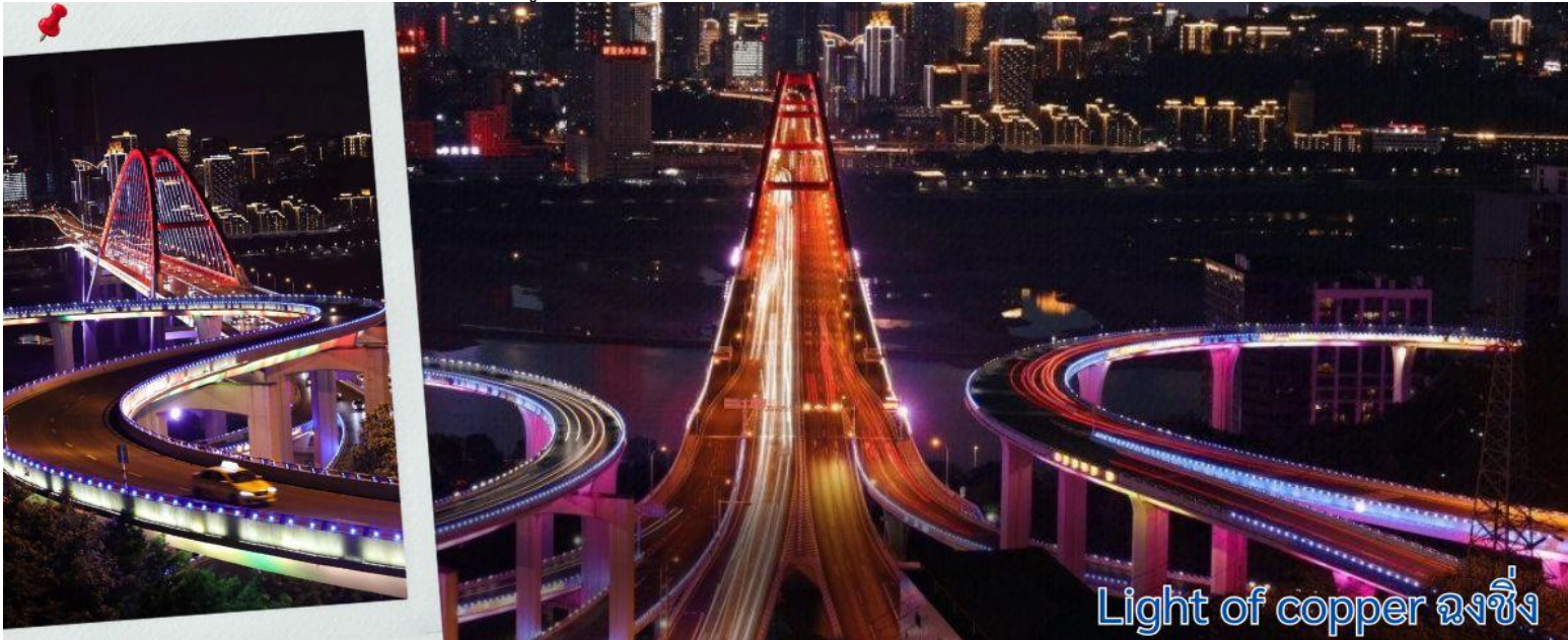
Light of copper ฉงชิ่ง

แนวถ่ายรูปวิวที่ Light of copper ฉงชิ่ง เป็นจุดชมวิวดังในมหานคร ฉงชิ่ง ประเทศจีน ซึ่งได้รับความนิยมอย่างมากในกลุ่มนักท่องเที่ยวและช่างภาพ จุดชมวิวดังนี้ตั้งอยู่ริมตลิ่งแม่น้ำฉงชิ่งที่เชื่อมต่อกันสามารถมองเห็นวิวพาโนรามาของ สะพานซูเจียปา (Sujiaba Interchange) ที่โค้งไปมาอย่างซับซ้อน และสะพานข้ามแม่น้ำแยงซีเกียง ไช่หยวนป่า (Caiyuanba Bridge) ท่ามกลางตึกสูงระฟ้าบรรยากาศยามค่ำคืน เมื่อเปิดไฟเมืองในช่วงค่ำจะเห็นแสงสีทองและสีทองแดง สะท้อนความงดงามของ "เมืองภูเขา" ได้อย่างชัดเจน