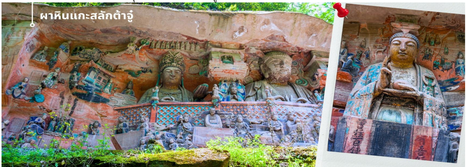
ผาหินแกะสลักต้าจู่

จากนั้นนำท่านเดินทางสู่ ผาหินแกะสลักต้าจู่ เขาเป่าตั้งซาน ผาหินแกะสลักที่ได้รับการบันทึกให้เป็นมรดกโลกทางวัฒนธรรม ที่ผสมผสานบนความเชื่อด้านศาสนาและเป็นงานศิลปะที่ผสมผสาน จุดเด่นของเมืองต้าจู่ที่แสดงถึงงานฝีมือในการแกะสลักถ้ำและผาหิน กลุ่มผาหินแกะสลักต้าจู่มีมากกว่า 70 จุด ซึ่งงานมากกว่า 1 แสนชิ้น ในนั้นถือว่า “เป่าตั้งซาน” และ “เป่ยซานม่อหย่า” สองสถานที่นี้มีหินแกะสลักชิ้นชื่อมากที่สุด เน้นไปทางพุทธศาสนาเป็นแบบอย่างของถ้ำหินแกะสลักของประเทศจีนในยุคศิลปะตอนปลาย และ หินแกะสลักเป่าตั้งซาน เป็นตัวหลักในการขุดเจาะแกะสลักอย่างยากลำบากกว่า 70 กว่าปี หินแกะสลักที่นี้จะแกะตามรูปลักษณ์ของตัวภูเขา ด้วยความปราณีต และพิถีพิถัน มีความสวยงามเพียงพร้อมด้วยเนื้อหอบอกเล่าและเตือนสติผู้พบเห็น และยังมีการจัดแบ่งงานฝีมือของแต่ละยุคไว้ เป็นการประชันของช่างในแต่ละยุค ด้านใต้จะเป็นงานในยุคถังตอนปลาย จนถึง ยุคห้ารัชกาล และ ด้านเหนือจะเป็นงานในสมัย ช่งเหนือซึ่งได้ ซึ่งงานฝีมือในแต่ละยุคจะสะท้อนความเป็นอยู่และค่านิยมที่ไม่เหมือนกัน