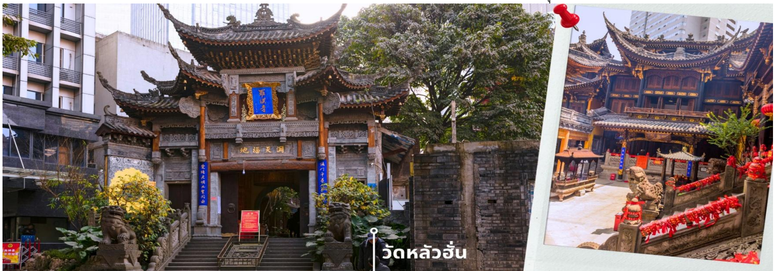
วัดหลัวฮั่น

นำท่านเดินทางสู่ วัดหลัวฮั่น (Luohan Temple) วัดสำนักงานใหญ่พุทธสมาคมแห่งนครฉงชิ่ง เป็นวัดเก่าแก่ที่สุดในฉงชิ่ง (Chongqing) ซึ่งสร้างขึ้นเมื่อ 1,000 ปีก่อน มีประวัติความเป็นมายาวนานเป็นจุดหมายทางศาสนาและเป็นศูนย์กลางของชาวพุทธในภูมิภาคการท่องเที่ยวที่สำคัญของภูมิภาค และเป็นแหล่งเรียนรู้ที่สำคัญของศิลปวัฒนธรรมจีน วัดนี้ประดิษฐานพระอรหันต์ถึง 500 องค์ แต่ละองค์มีลักษณะ ท่าทาง และสีหน้าแตกต่างกัน มีสถาปัตยกรรมแบบจีนโบราณที่สวยงามและละเอียดอ่อน พระอรหันต์ 500 องค์ แกะสลักด้วยหินและไม้ สะท้อนถึงความเชื่อในพุทธศาสนาและฝีมือศิลปะจีน