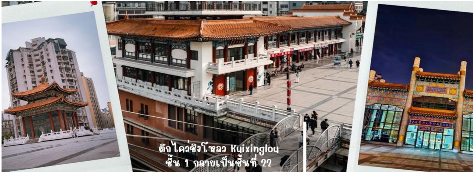
ตึก ไคว่ซิง โหลว Kuixinglou ชั้น 1 กลายเป็นชั้นที่ 22

จากนั้น นำท่านเดินทางสู่ จัตุรัสเฉาเทียนเหมิน ซึ่งตั้งอยู่ ณ จุดบรรจบของ แม่น้ำแยงซี และ แม่น้ำเจียหลิง นับเป็นท่าเรือขนส่งทางน้ำที่ใหญ่ที่สุดของนครฉงชิ่ง และเป็นศูนย์กลางการค้าสำคัญมาอย่างยาวนาน บริเวณนี้ยังเป็นที่ตั้งของ ตลาดการค้าครบวงจรเฉาเทียนเหมิน ซึ่งถือเป็นตลาดขนาดใหญ่ที่สุดของฉงชิ่ง ทำให้พื้นที่โดยรอบเต็มไปด้วยผู้คนและมีชีวิตชีวาอยู่เสมอ ตั้งแต่อดีตจนถึงปัจจุบัน จัตุรัสแห่งนี้ได้รับการออกแบบให้มีลักษณะคล้ายเรือยักษ์ที่กำลังแล่นออกสู่สายน้ำอย่างสง่างาม จึงได้รับสมญานามว่า “ไททานิคแห่งฉงชิ่ง” เมื่อยืนอยู่บนจัตุรัส ท่านจะสามารถมองเห็นภาพอันน่าประทับใจของจุดบรรจบระหว่างแม่น้ำสองสาย โดยน้ำสีเหลืองของแม่น้ำแยงซีและน้ำสีเขียวมรกตของแม่น้ำเจียหลิงไหลมาบรรจบกันอย่างชัดเจน สร้างทัศนียภาพที่สวยงามและเป็นเอกลักษณ์ของฉงชิ่งอย่างแท้จริง