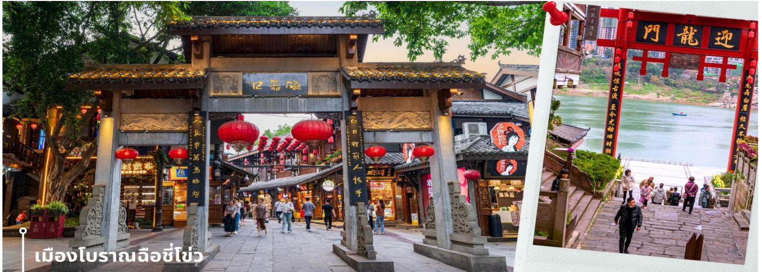
เมืองโบราณฉือโข่ว

เที่ยวฉงชิ่ง ที่เหมาะแก่การมาเดินเที่ยว ชิมอาหาร ถ่ายรูป และสัมผัสวิถีชีวิตแบบดั้งเดิมของชาวฉงชิ่งอย่างใกล้ชิดในบรรยากาศที่แสนสบาย