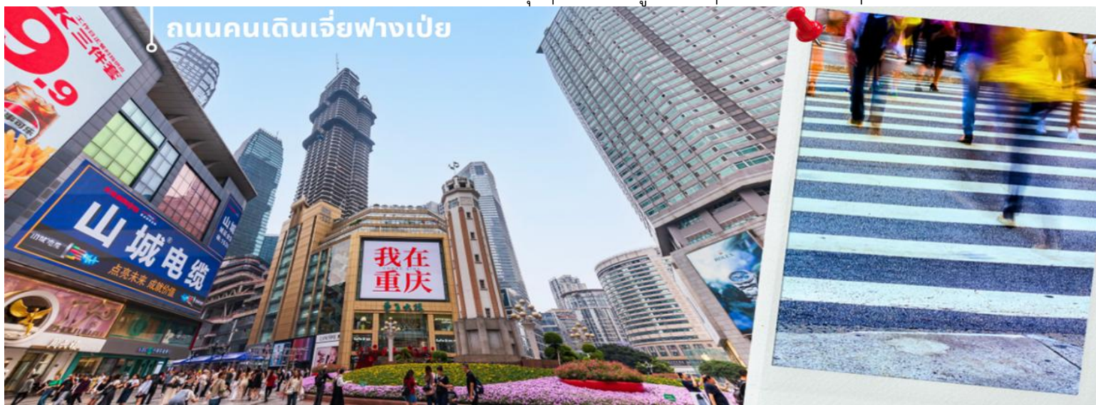
ถนนคนเดินเจียฟางเป่ย

อิสระข้อปั้ง ย่านเจียฟางเป่ย ย่านธุรกิจสุดหรู ใจกลางเมืองฉงชิ่งความเป็นจริงแล้ว ที่นี่เรียกได้เป็นใจกลางเมืองที่มีแหล่งธุรกิจต่างๆ ซึ่งรวมไปด้วยทั้งตึกสูง แหล่งรวมแบรนด์เนมชื่อดังต่างๆ ที่ใครมาเมืองฉงชิ่งแล้วนั้น จะต้องมาเดินเที่ยวที่นี่ เป็นสถานที่สุดฮิตของวัยรุ่นฉงชิ่ง คล้ายกับสยามบ้านเรา เป็นแหล่งข้อปั้งแบรนด์ดังหลายแบรนด์รวมอยู่ที่นี่ มีร้านอาหาร ร้านหม่าล่า คาเฟ่ เป็นอีกที่ที่ต้องแวะข้อปั้ง ชิมกันแบบจุกๆ ตรงนี้ถ้าयरูปสตรีทๆออกมาได้ซิคมากๆ