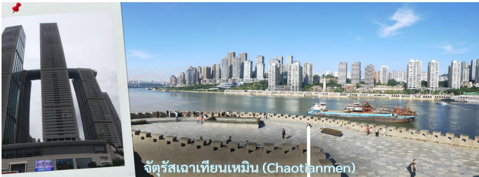
จัตุรัสเฉาเทียนเหมิน (Chaotianmen)

จากนั้น นำท่านเดินทางสู่ จัตุรัสเฉาเทียนเหมิน ซึ่งตั้งอยู่ ณ จุดบรรจบของ แม่น้ำแยงซี และ แม่น้ำเจียหลิง นับเป็นท่าเรือขนส่งทางน้ำที่ใหญ่ที่สุดของนครฉงชิ่ง และเป็นศูนย์กลางการค้าสำคัญมาอย่างยาวนาน บริเวณนี้ยังเป็นที่ตั้งของ ตลาดการค้าครบวงจรเฉาเทียนเหมิน ซึ่งถือเป็นตลาดขนาดใหญ่ที่สุดของฉงชิ่ง ทำให้พื้นที่โดยรอบเต็มไปด้วยผู้คนและมีชีวิตชีวาอยู่เสมอ ตั้งแต่อดีตจนถึงปัจจุบัน จัตุรัสแห่งนี้ได้รับการออกแบบให้มีลักษณะคล้ายเรือยักษ์ที่กำลังแล่นออกสู่สายน้ำอย่างสง่างาม จึงได้รับสมญานามว่า “ไททานิคแห่งฉงชิ่ง” เมื่อยืนอยู่บนจัตุรัส ท่านจะสามารถมองเห็นภาพอันน่าประทับใจของจุดบรรจบระหว่างแม่น้ำสองสาย โดยน้ำสีเหลืองของแม่น้ำแยงซีและน้ำสีเขียวมรกตของแม่น้ำเจียหลิงไหลมาบรรจบกันอย่างชัดเจน สร้างทัศนียภาพที่สวยงามและเป็นเอกลักษณ์ของฉงชิ่งอย่างแท้จริง